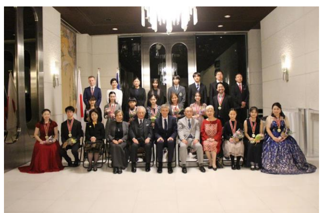
2023年度表彰式・披露演奏会