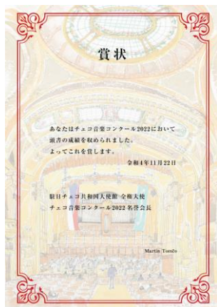
表彰状（スメタナホール）